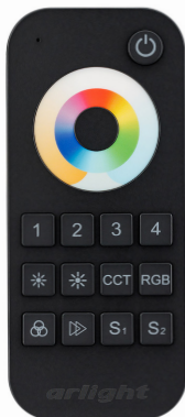
SMART-R22-MULTI Black Арт. 023473