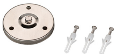
Рис. 3. Основание для установки на поверхность (арт. 024890).