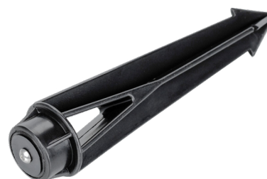
Рис. 4. Основание для установки в грунт (арт. 024889).